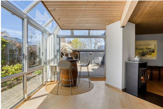
Glaskarnap i stue med udgang til terrasse