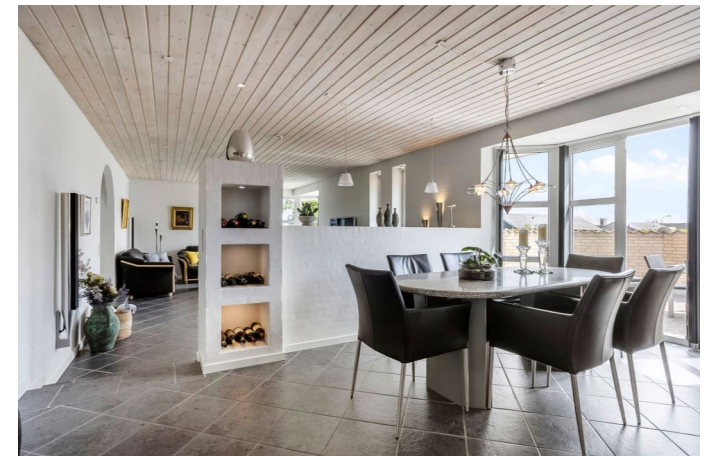
Kig mod stue