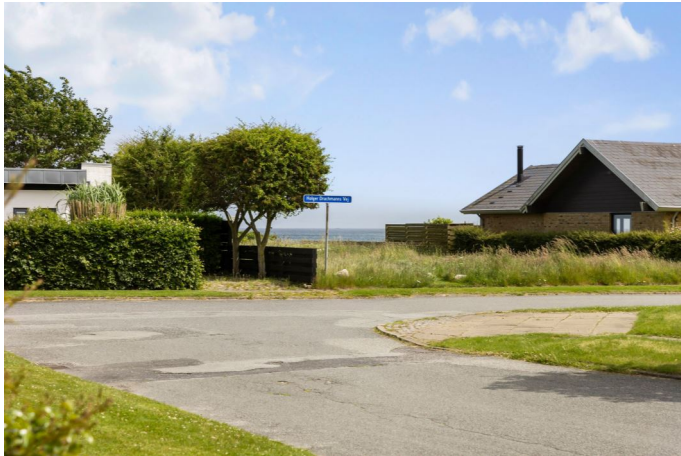
Kig mod vandet