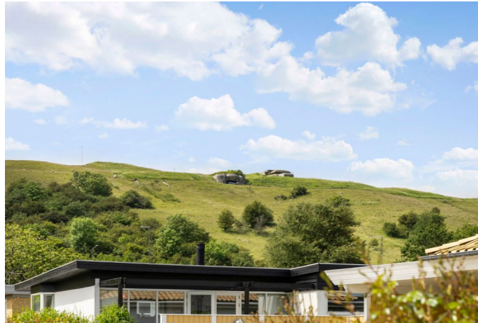
Bakkelandskabet mod vest