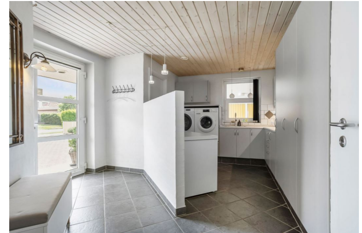
Kombineret entre og bryggers