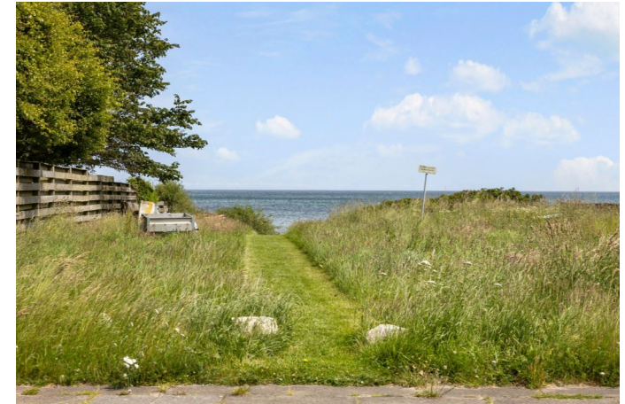
Adgang til vandet via fredet areal