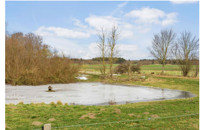
Udsigt til nabo sø fra baghaven