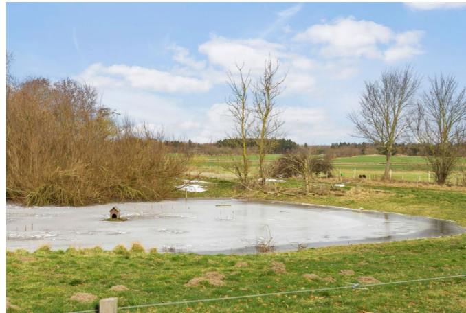
Udsigt til nabo sø fra baghaven