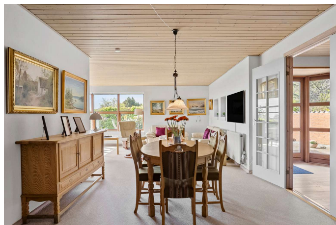
Opholds- og spisestue