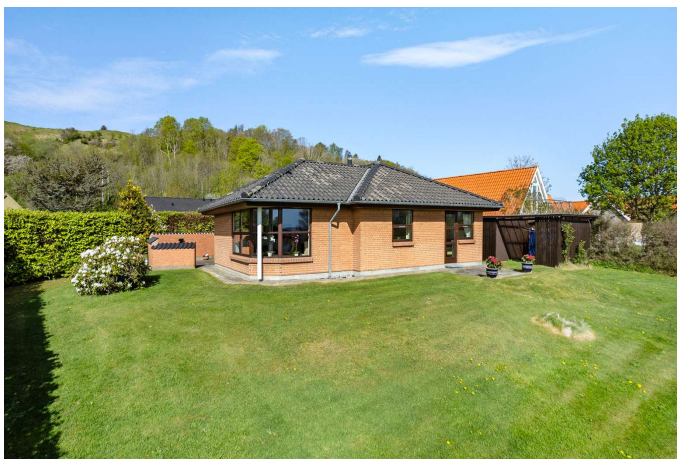
Facade set fra haven