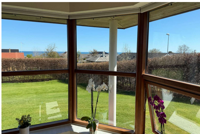
Udsigt fra stue