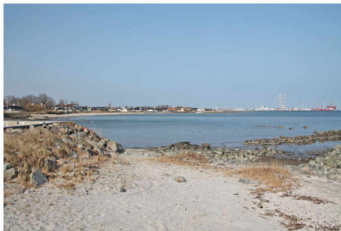
Kig mod syd fra vandkanten