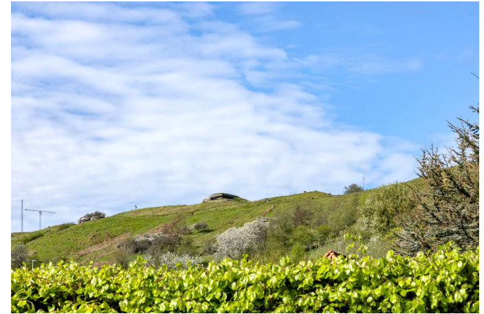
Kig mod bakkerne