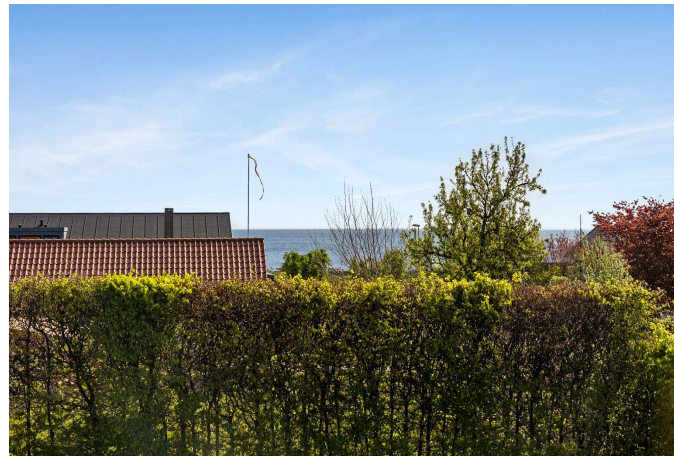
Kig fra grunden