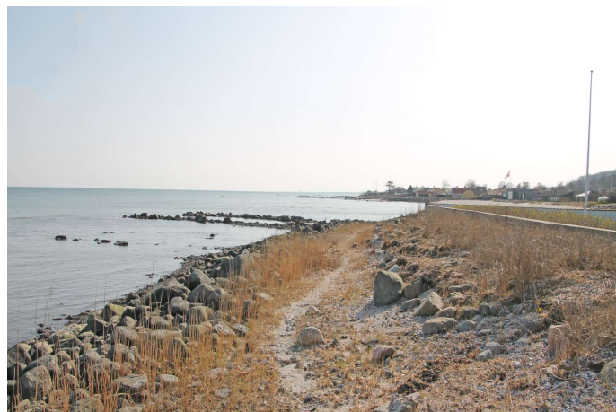
Kig mod nord fra vandkanten