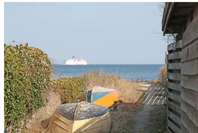
Beliggende tæt på adgang til vandkanten