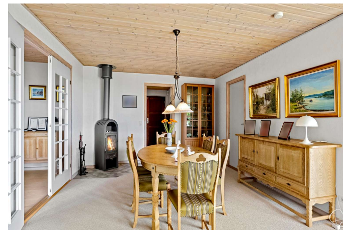
Spisestueafsnit med brændeovn