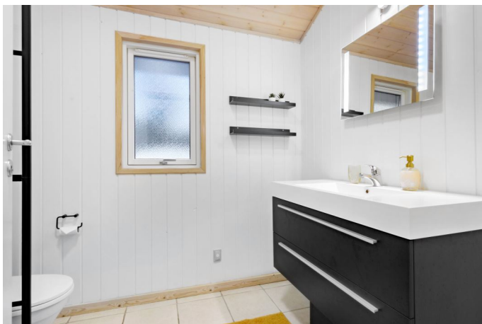
Badeværelse ved de 3 soveværelser