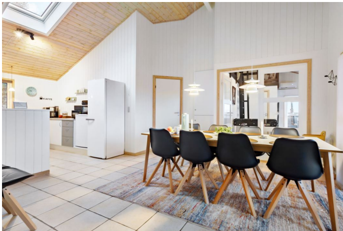
Alrum med kig til aktivitetsrum